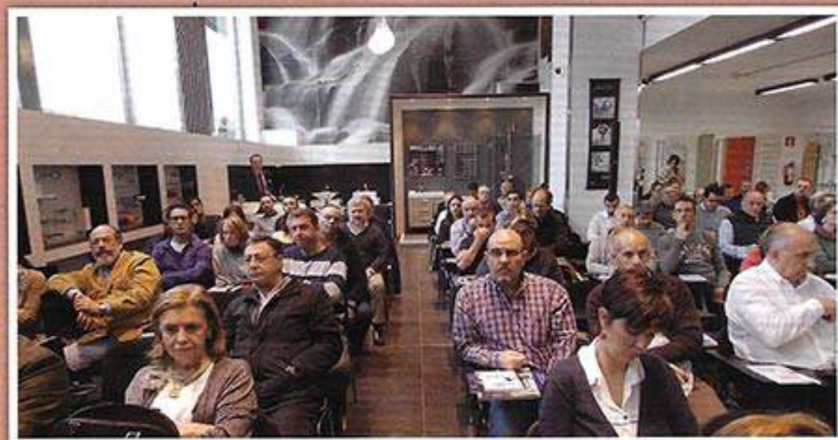
» El 'Meeting Sop' de 'tureforma' congregó a más de 150 profesionales.