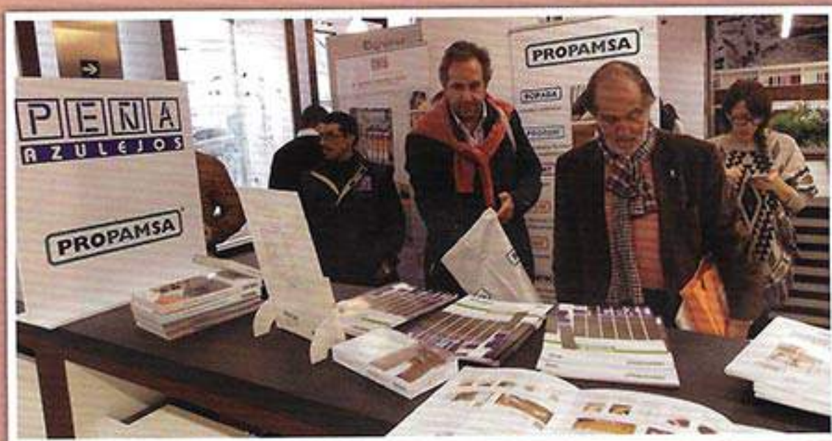
» Una vez concluidas las ponencias, los asistentes pudieron acercarse a los diferentes stands de las firmas.